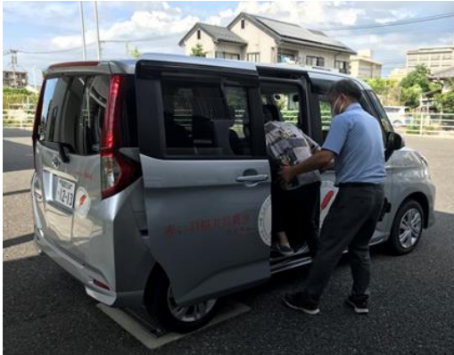
福祉施設の車両整備事業

赤い羽根共同募金は、地域の支えあいの活動から災害時の支援まで、「じぶんの町を良くする」活動に幅広く役立てられています。