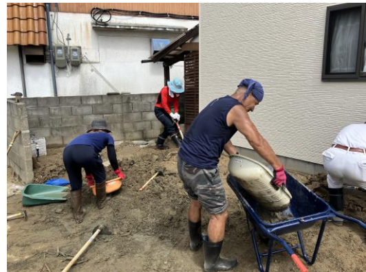
大規模災害時のボランティア活動支援