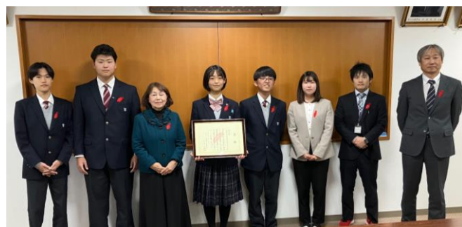
近畿大学附属福岡高等学校での表彰式

福岡県立福岡高等聴覚特別支援学校 福岡市立南福岡特別支援学校 福岡県立柳河特別支援学校 福岡県立筑後特別支援学校