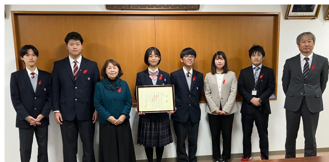
近畿大学附属福岡高等学校での表彰式