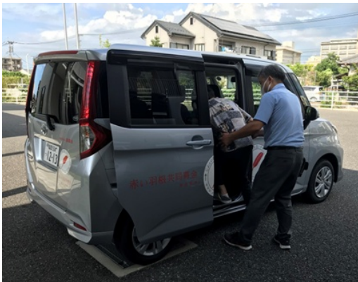
福祉施設の車両整備事業

赤い羽根共同募金は、地域の支えあいの活動から災害時の支援まで、「じぶんの町を良くする」活動に幅広く役立てられています。