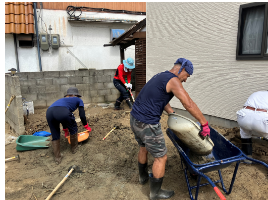
大規模災害時のボランティア活動支援