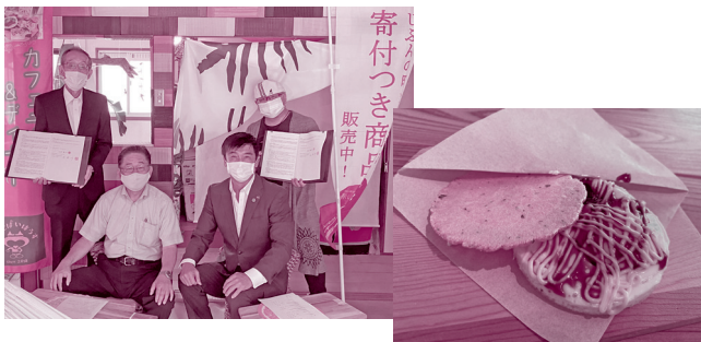
みーとばいはうす（中間市） たません1個 130円につき10円を寄付