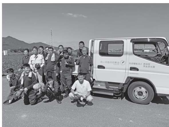
障害者施設の車両整備