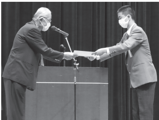
令和2年福岡県社会福祉功労者表彰式