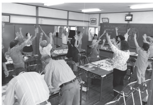
高齢者のサロン事業