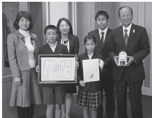
学校での表彰(みやま市立桜舞館小学校)