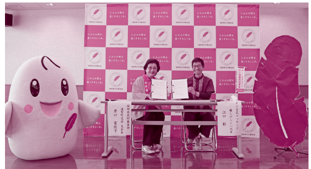
タイ古式マッサージ 癒しのシンハ（遠賀町） マッサージ90分（5,000円）につき、 100円を寄付

詳しくは、下記ホームページをご覧ください。ご不明な点はお気軽にお問い合わせください。