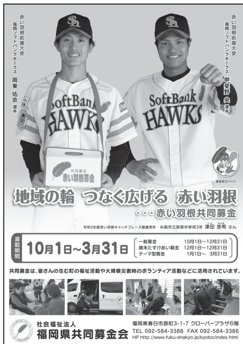
共同募金運動ポスター

また、球団マスコット(ハリーホーク)と赤い羽根がコラボレーションしたバッジを作製し、広報活動を強化しています。