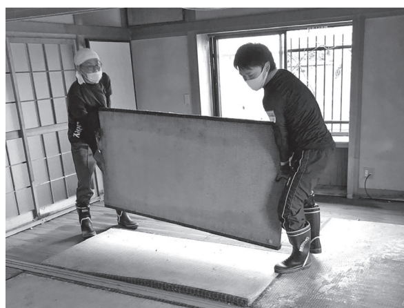
大規模災害時のボランティア活動支援