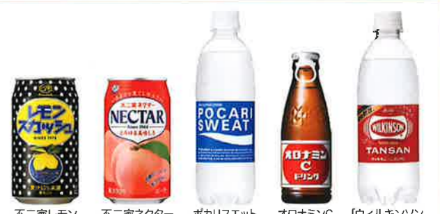
不二家レモン スカッシュ 350ml 缶 不二家ネクター ビーチ 350g 缶 ポカリスエット 500ml PET オロナミンC 120ml 瓶 「ウィルキンソン」タンサン※ 500ml PET (地域限定)

※「ウィルキンソン」「WILKINSON」は、アサヒ飲料株式会社の登録商標です。