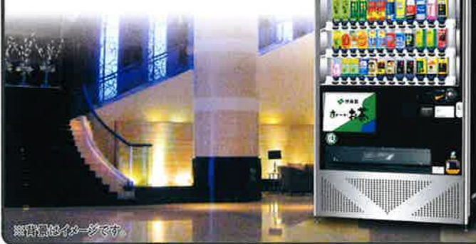
※背景はイメージです。