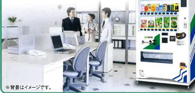
※背景はイメージです。