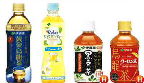
黄金烏龍茶 500ml PET リラックス ジャスミンティー 500ml PET からだにいいこと 黒豆茶 275ml PET 烏龍茶 275ml PET