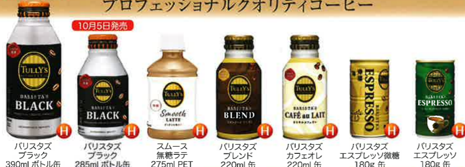
10月5日発売 バリスタズ ブラック 390ml ボトル缶 バリスタズ ブラック 285ml ボトル缶 スムース 無糖ラテ 275ml PET バリスタズ ブレンド 220ml 缶 バリスタズ カフェオレ 220ml 缶 バリスタズ エスプレッソ 180g 缶 バリスタズ エスプレッソ 180g 缶