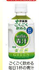
ごくごく飲む 毎日1杯の青汁 280g PET