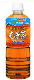
健康ミネラルむぎ茶 600ml PET カフェインゼロ