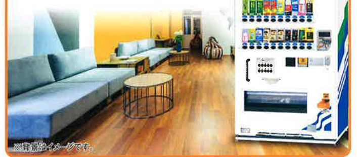
※背景はイメージです。

ユニバーサルガイドラインに準拠した、最大限突出部を少なくしたデザイン・機能です。