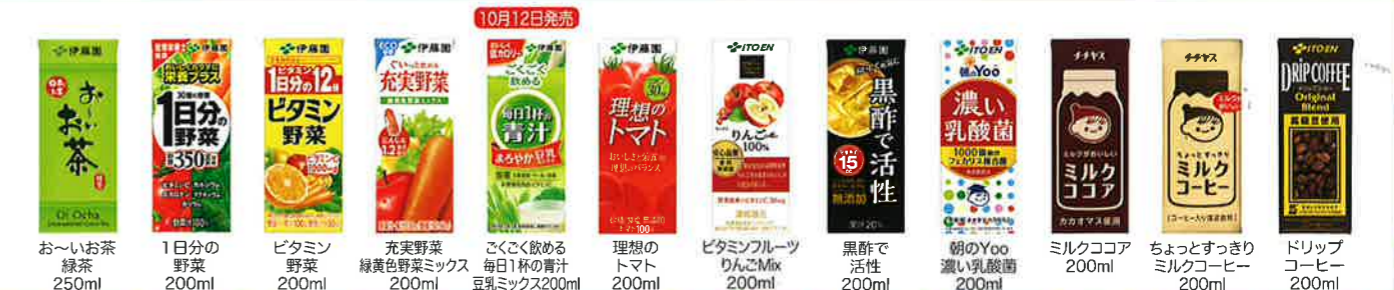
お〜お茶 緑茶 250ml 1日分の野菜 200ml ビタミン 野菜 200ml 充実野菜 緑黄色野菜ミックス 200ml ごくごく飲む 毎日1杯の青汁 豆乳ミックス200ml 理想の トマト 200ml ビタミンフルーツ りんごMix 200ml 黒酢で 活性 200ml 朝のYoo 濃い乳酸菌 200ml ミルクココア 200ml ちょっとすっきり ミルクコーヒー 200ml ドリップ コーヒー 200ml

※一部の製品によっては取り扱いのない商品がございます。また、季節により廃売となる商品もございます。詳しくは、セールスマンにお問い合わせください。