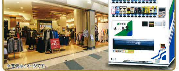
※背景はイメージです。