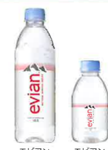
エビアン 500ml PET エビアン 220ml PET