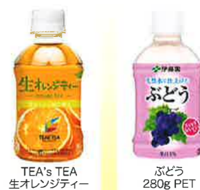
TEA'S TEA 生オレンジティー 280ml PET ぶどう 280g PET