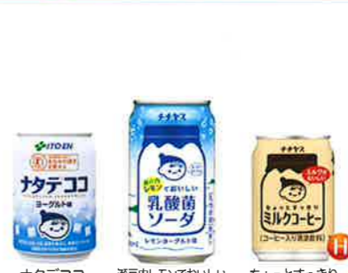
ナタデココ ヨーグルト味 280g 缶 瀬戸内レモンでおいしい 乳酸菌ソーダ 350ml 缶 ちょっとすっきり ミルクコーヒー 250g 缶