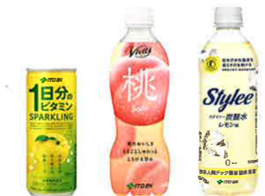
1日分のビタミン スパークリング 250ml 缶 Vivit's 桃 ソーダ 450ml PET スタイリー 炭酸水 レモン味 500ml PET