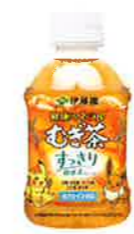
健康ミネラルむぎ茶 すっきり健康茶ブレンド 280ml PET (全4種) カフェインゼロ