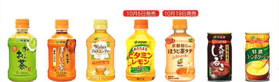
お〜お茶 275ml PET お〜お茶 ほうじ茶 275ml PET リラックス ジャスミンティー HOT&COLD 275ml PET あたたまる ビタミンレモン 280g PET TEA'S TEA 京都焙じ入り ほうじ茶ラテ 275ml PET 大納言 しるこ 185g 缶 特濃 コーンポタージュ 185g 缶