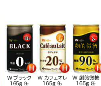
W ブラック 165g 缶 W カフェオレ 165g 缶 W 劇的の微糖 165g 缶