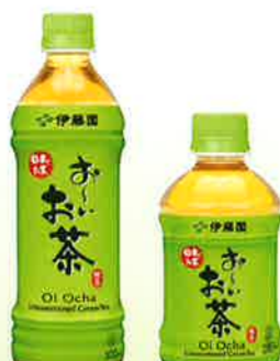
お〜お茶 緑茶 500ml PET お〜お茶 緑茶 280ml PET

「おいしさは鮮度」 国産茶葉を100%使用した、 香り高く、まろやかで 味わい深い緑茶飲料 無香料、無調味