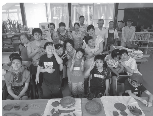
障害をもっている児童・生徒と家族を対象として、長期休暇中のレスパイトケア及び子どもたちの居場所づくり