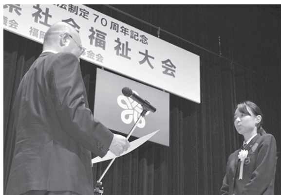
平成29年福岡県社会福祉大会での表彰式の様子