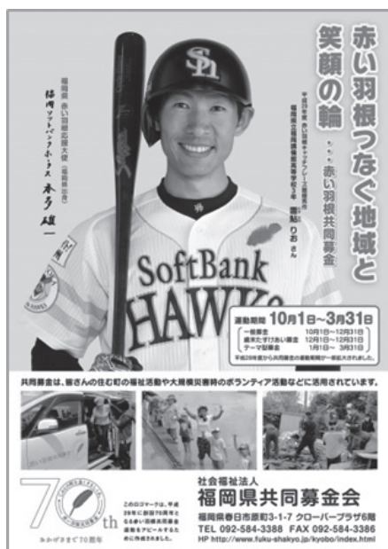
共同募金運動ポスター

また、平成25年度からは球団マスコット（ハリーホーク）と赤い羽根がコラボレーションしたバッジを作製し、広報活動を強化しています。