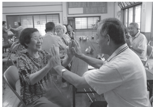
高齢者同士のつながりを支援するサロン事業