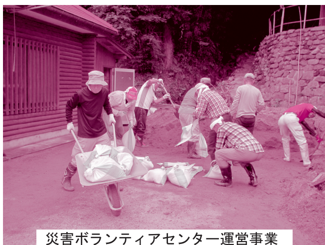
災害ボランティアセンター運営事業 (平成29年7月九州北部豪雨災害)