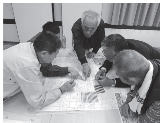
災害時、地域住民が円滑に避難するための勉強会