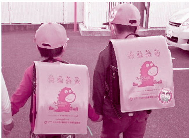
子どもたちの暮らしと環境を守る事業

お寄せいただいた募金は、福岡県内の地域福祉や大規模災害時のボランティア活動の支援などに活用されています。