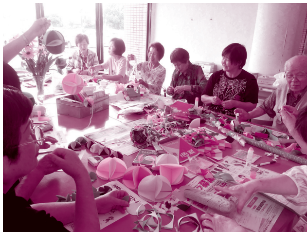
趣味・特技を活かしたサロン活動