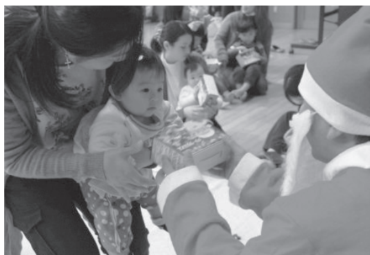
地域の子育てサロンや障がい児施設の子どもたちにサンタクロースからクリスマスプレゼント