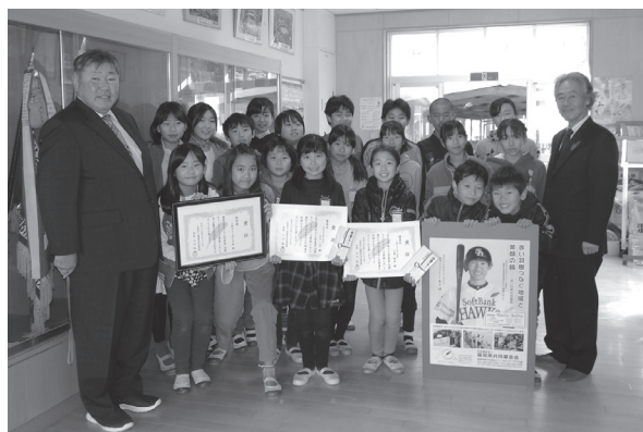
学校での表彰の様子(小郡市立三国小学校)